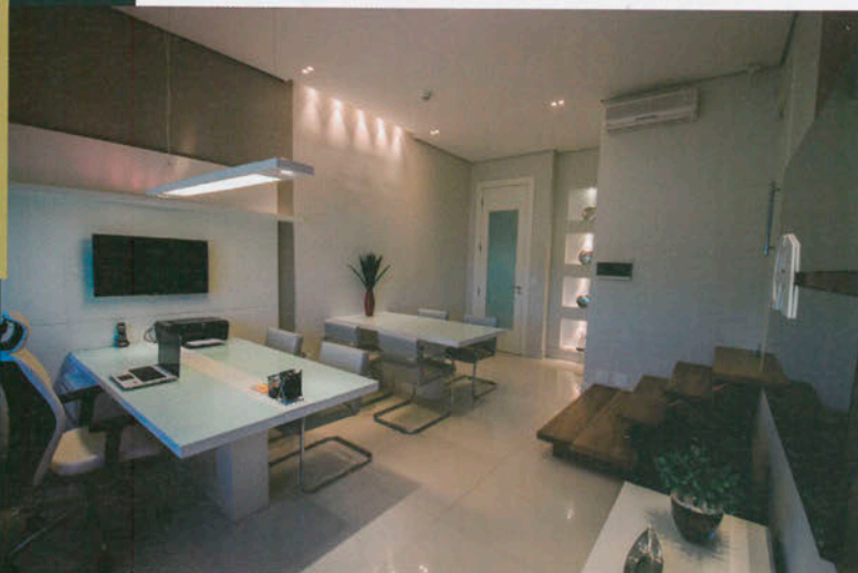
Recurso com efeito "wall-whashing" embeleza e destaca a parede