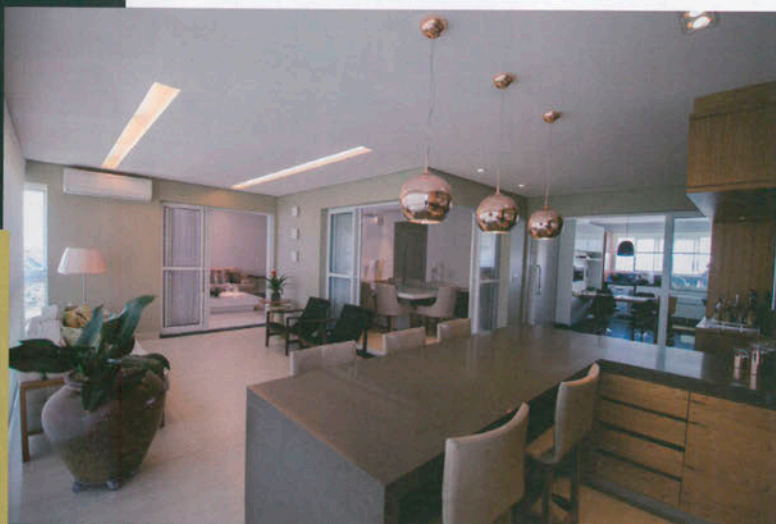
Espaço gourmet com lustres pendentes a 90cm da bancada

Em caso de reformas, a solução é trabalhar com o que já existe construído. Por isso, antes de pensar na instalação das novas luminárias, deve-se revisar a carga e a rede elétrica disponíveis.